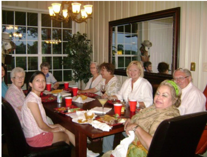
Los Asociados de Houston disfrutaron de una cena antes de empezar con su junta de planeamiento.

La membresía de los Asociados de Houston está creciendo y con el nuevo cambio de liderazgo este retiro ofreció una buena oportunidad para rezar y hacer un poco de pre-planeamiento para el año que empieza. Esta sesión será