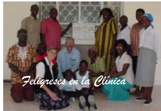
Feligreses en la Clínica

otra. No se trata necesariamente de que cada participante traiga la misma cantidad de bienes a la mesa. Más bien, se trata de que cada participante venga a la mesa y diga, “Aquí estoy. Estos son los dones que tengo. He venido a caminar contigo.” Si he aprendido una cosa sobre misión, es esto: Nunca se hace misión en aislamiento – Estamos juntos... muchas manos, muchos corazones, muchos sueños, muchos problemas, y muchas, muchas oraciones. “Tuka pamoja” es una frase en suahili que significa: “Estamos juntos.” Toma que todos nosotros trabajemos juntos.