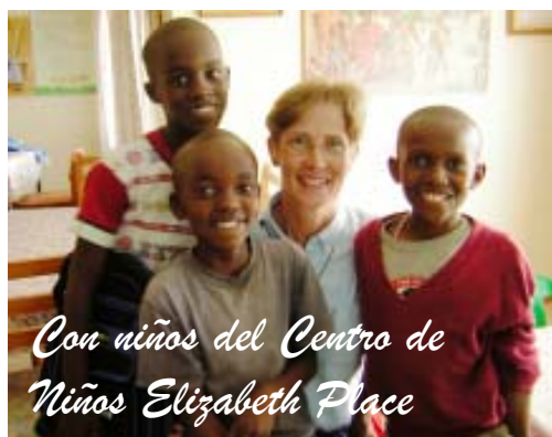
Con niños del Centro de Niños Elizabeth Place

Y luego, está la misma gente de Utawala, la gente a quien esta clínica sirve. Su gratitud y asistencia a St. Bakhita cuentan la otra parte de la historia. Ellos viven en un ambiente en donde sueños y esperanzas abundan. Para algunos es el sueño de una educación para otros puede ser el sueño de un empleo significativo y estable. Algunas veces es la esperanza que la aldea reciba electricidad, agua y cuidado de la salud de confianza. Para muchos otros es el sueño de ser propietarios de su propia parcela de terreno para poder construir su casa y plantar comestibles para alimentar a su familia. Para aquellos que son huérfanos o desplazados es el sueño de tener un lugar y una familia en donde se pueden sentir seguros, amados y en casa. Y para aquellos comprometidos a compartir una vida común centrada en Cristo,