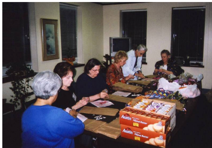
Asociados preparando bolsas de San Valentín para los clientes de Nuestro Pan de Cada Día

terios como grupo. Los Asociados de Long Beach preparan y sirven cena para cerca de 60 personas sin hogar un día al mes en el Proyecto Achieve, una agencia de Caridades Católicas que sirve a las personas sin hogar. Ellos también colecta dinero y cereal durante sus juntas mensuales para esta agen-