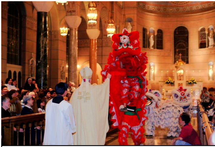
El león acepta un regalo de "dinero" del Arzobispo Fiorenza